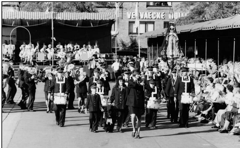
Onze fanfare in Izegem in 1997 (Met dank aan de Stedelijke Informatiedienst Izegem) (foto Terma)

De wedstrijd begint om 15.00 u. en onze fanfare zal er brengen: The Standard of Saint-George (opkomen), Spain (stilstaand) en Death or Glory (afgaan).